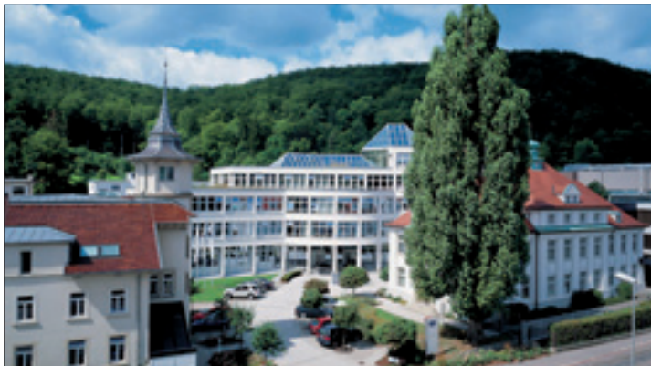
Die Unternehmenszentrale in Heidenheim