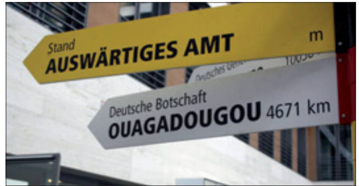
Ouagadougou ist die Hauptstadt von Burkina Faso in Westafrika.

Der Freiwilligendienst des Auswärtigen Amts