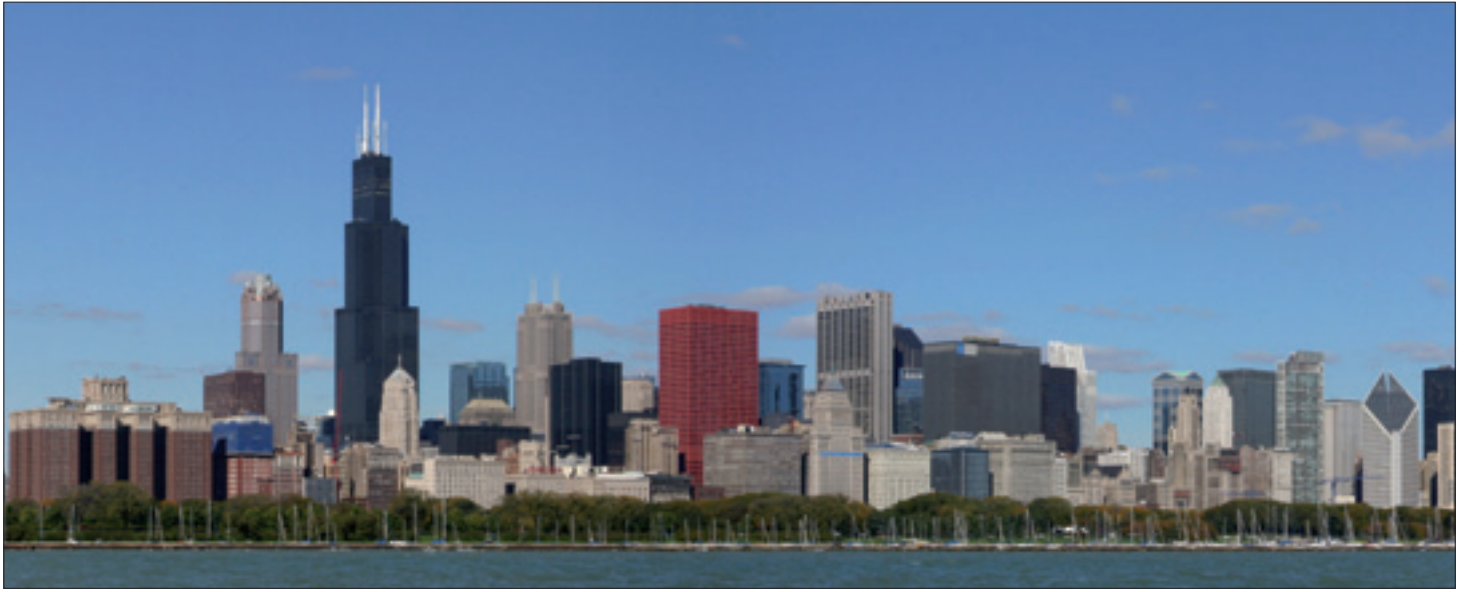
Checagou nannten die Potawatomi-Indianer das Marschland, auf dem später die Stadt Chicago gegründet wurde.