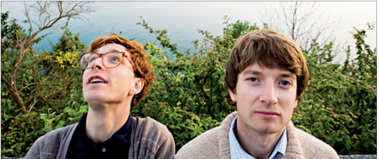
Erlend Øye (l.) & Eirik Glambek Bøe (r.)