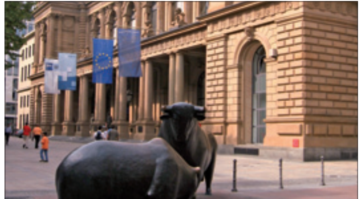
Die Frankfurter Börse